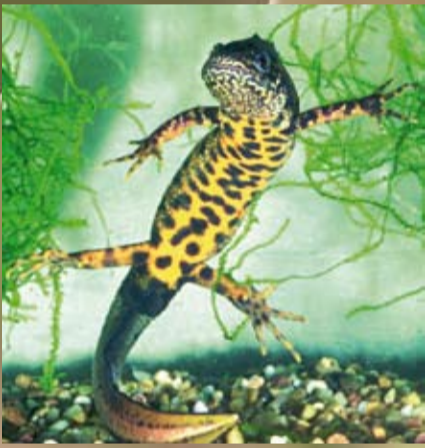
Tritonus puošia geltoni ar oranžiniai pilveliai su juodais taškeliams