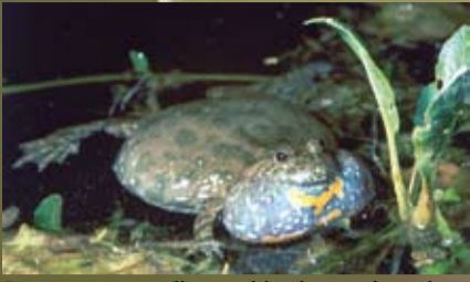
Pavasarij nuo telkinių sklinda raudonpilvių kūmučių patinų tuoktuvinės „giesmės“, primenančios gegutės kukavimą „Kuu-kuu“