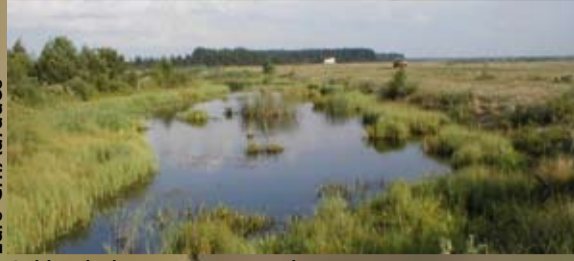
Seklios balos su gausia vandens augmenija - geriausia neršimo vieta skiauterėtiesiems tritonams ir raudonpilvėms kūmutėms