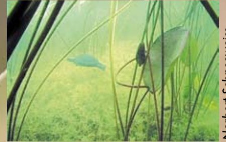
Balinis vėžlys vandenyje