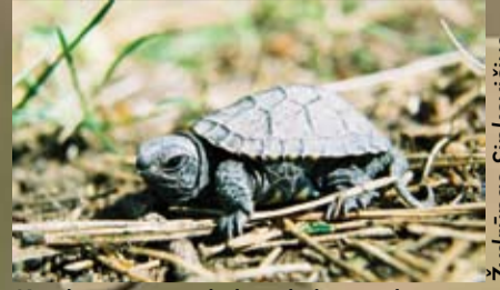
Ką tik išsiritęs vėžliukas dydžiu ne kažin kiek lenkia degtukų dėžutę