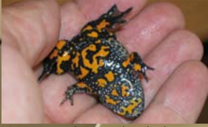
Nors ir nenuodinga raudonpilvė kūmutė išgaudina priešus ryškiomis spalvomis