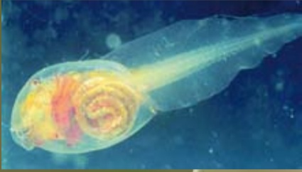
Raudonpilvės kūmutės lerva