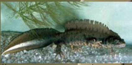
Skiauterėtojo tritono patinėlis tuoktvių metu