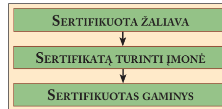
3 pav. Išskirtinis Kilmės patvirtinimo sertifikavimas.