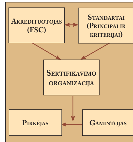
1 pav. FSC sertifikavimo proceso dalyviai ir jų tarpusavio ryšiai.

Taigi sertifikavimo organizacija įvertina SSĮ . Kad vertinimas būtų nuoseklus ir patikimas, ji vadovaujasi pasaulyje pripažintais standartais . Sertifikavimo organizacijos atliekamą darbą nuolatos stebi ir vertina akredituotojas . Jis užtikrina, kad SSĮ įvertinimas būtų atliktas nepriklausomai, nuosekliai ir aiškiai.