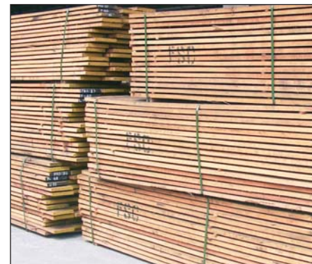
5 pav. FSC sertifikuotų gaminių ženklinimo pavyzdžiai.